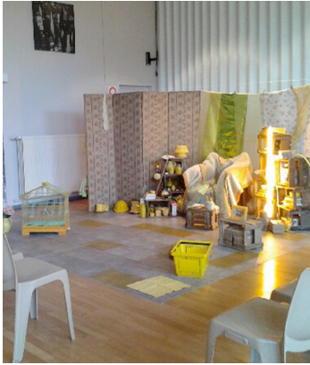
versions tout terrain